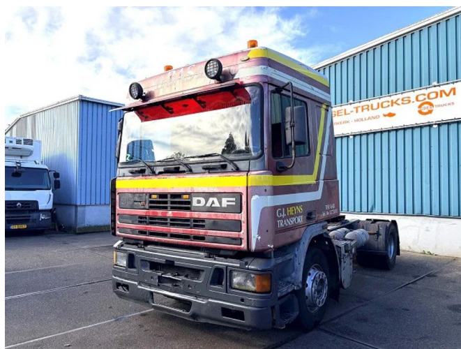
DAF 95.360 ATI SPACECAB (DUTCH TRUCK) (EURO 2... 4x2