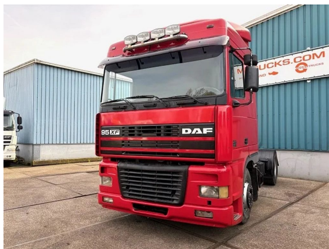
DAF 95.430 XF SPACECAB (EURO 2 / ZF16 MANUAL ... 4x2