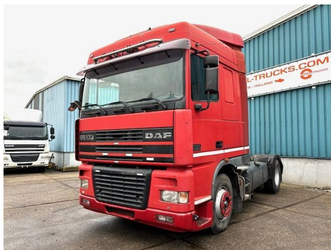
DAF 95.480 XF SPACECAB (EURO 3 / ZF16 MANUAL ... 4x2