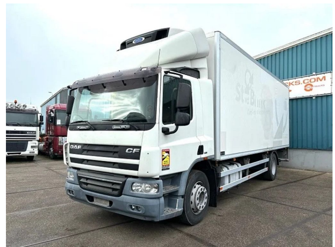
DAF CF 65.250 COOLING TRUCK WITH CARRIER D/E... 4x2