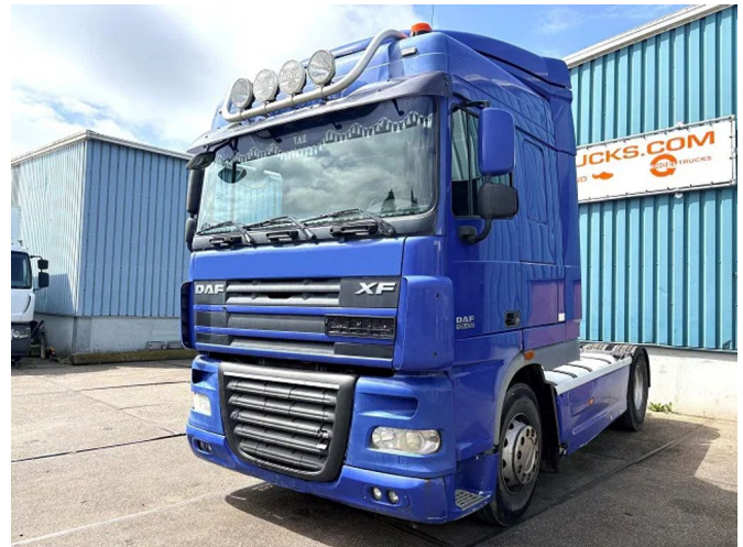
DAF XF 105.460 ATE SPACECAB 4x2 (EURO 5 / ZF12 MA...