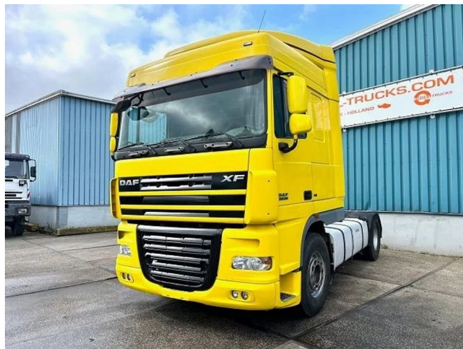
DAF XF 105.460 SPACECAB WITH HYDRAULIC KIT (... 4x2