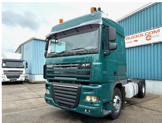
DAF XF 105.460 SPACECAB WITH KIPPER HYDRAUL... 4x2