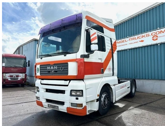
MAN TGA 18.460 FLS XXL (6 CILINDERHEADS!!) (ZF1... 4x2 Referenznummer: SN 56429608