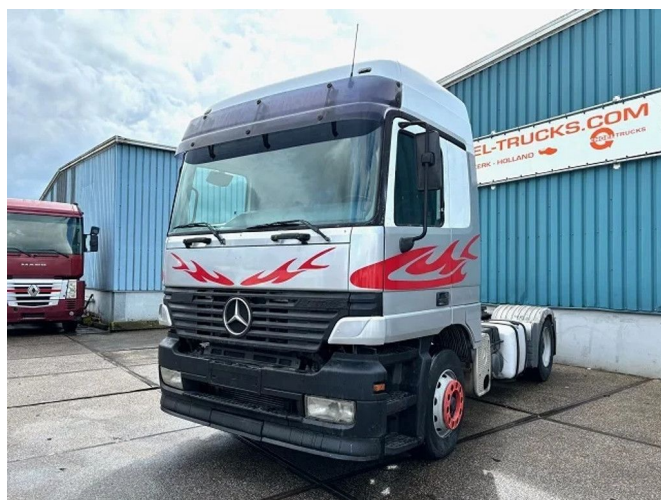
Mercedes-Benz Actros 1843 LS (MP1) (EPS WITH CLU... 4x2