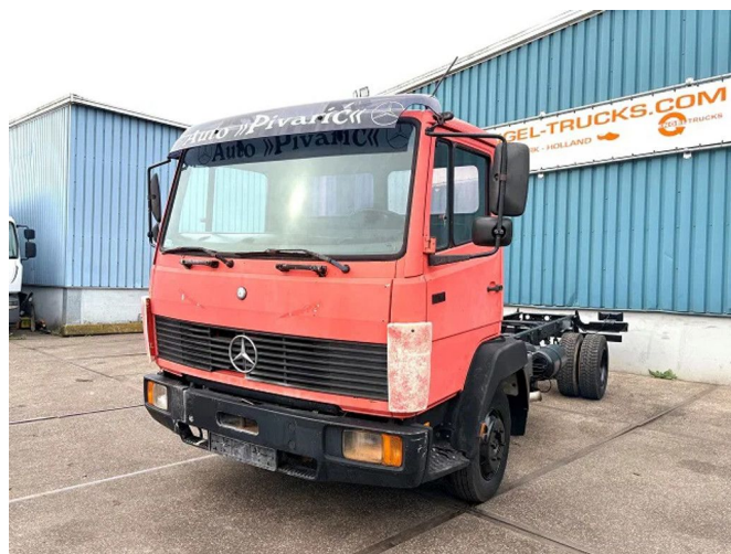
Mercedes-Benz LK 814K 4x2 (6-CILINDER) FULL STEEL C...