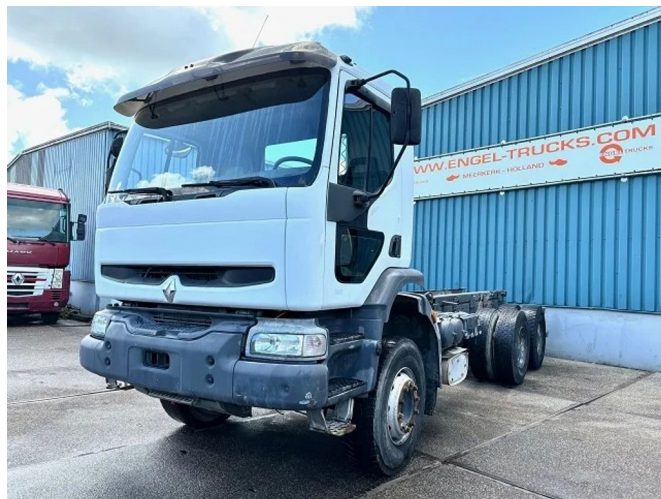
Renault Kerax 320 6x4 FULL STEEL CHASSIS (MANUAL G...