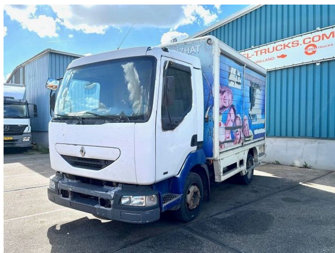
Renault Midlum 135.08 FULL STEEL WITH CLOSED D... 4x2