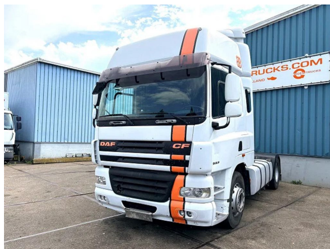
DAF CF 85.410 SPACECAB (EURO 5 / ZF16 MANUAL... 4x2