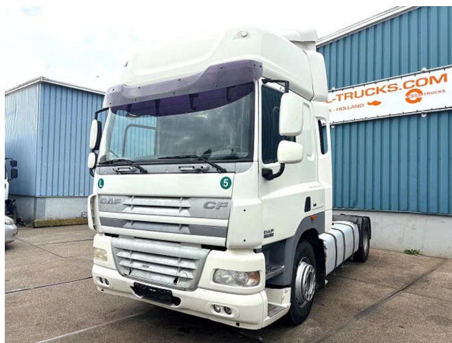
DAF CF 85.460 SPACECAB (ZF16 MANUAL GEARBO... 4x2 Referentienummer: SN 60315837 Z