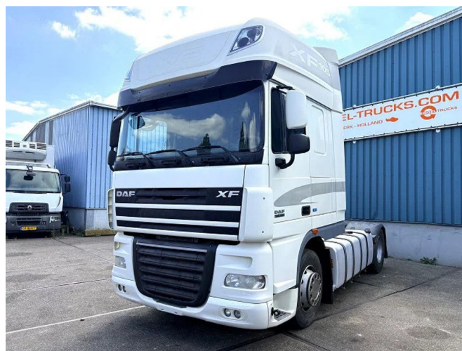
DAF XF 105.460 ATE SUPERSPACECAB (EURO 5 / Z... 4x2 Referentienummer: SN 60383030