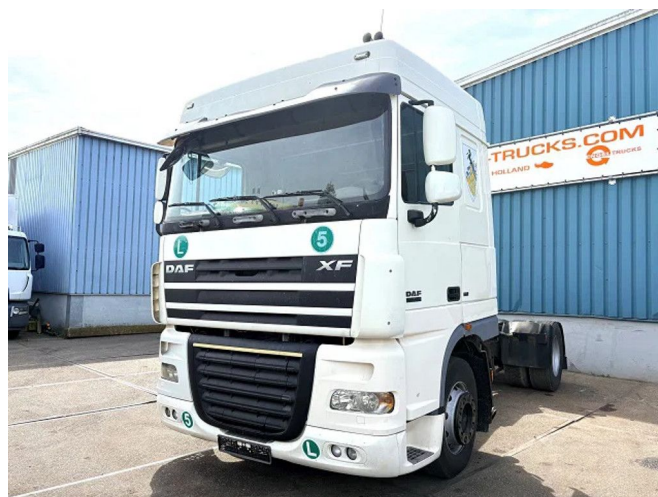
DAF XF 105.460 SPACECAB (EURO 5 / ZF16 MANUAL... 4x2