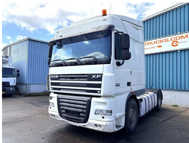
DAF XF 105.460 SPACECAB (EURO 5 / ZF16 MANUA... 4x2