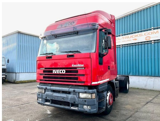
Iveco Eurostar 440.43 T/P HIGH ROOF (ZF16 MANUAL... 4x2