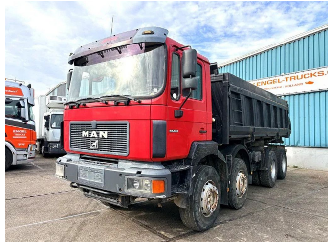
MAN 35 .403DF 8x4 MEILLER KIPPER (EURO2 / ZF16 MA...