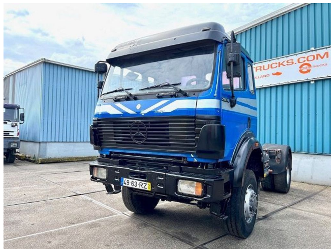
Mercedes-Benz SK 2038 AS V8 4x4 FULL STEEL SUSPENS... Referentienummer: SN 54669944

• ABS • Limitador de velocidad • Parasol • PTO • Radio / reproductor de CD