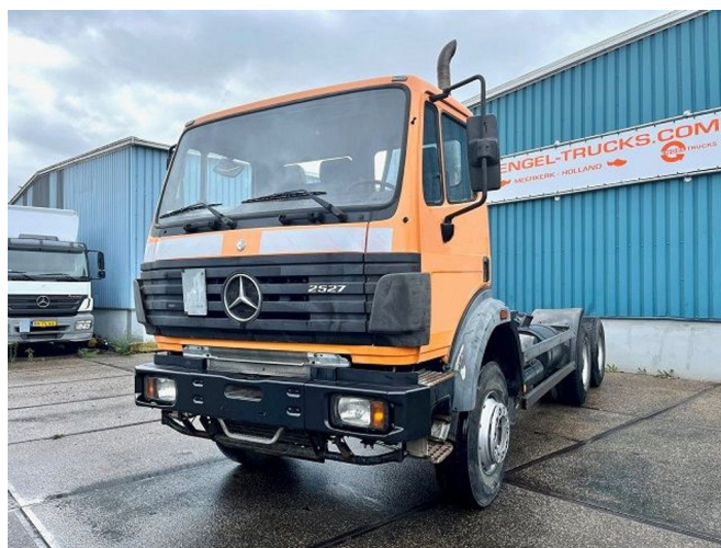
Mercedes-Benz SK 2527 K 6x4 FULL STEEL CHASSIS (MA...