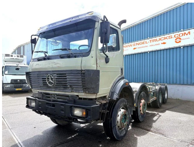
Mercedes-Benz SK 3234 B 8x4 FULL STEEL CHASSIS (V6 ... Referentienummer: SN 59995734