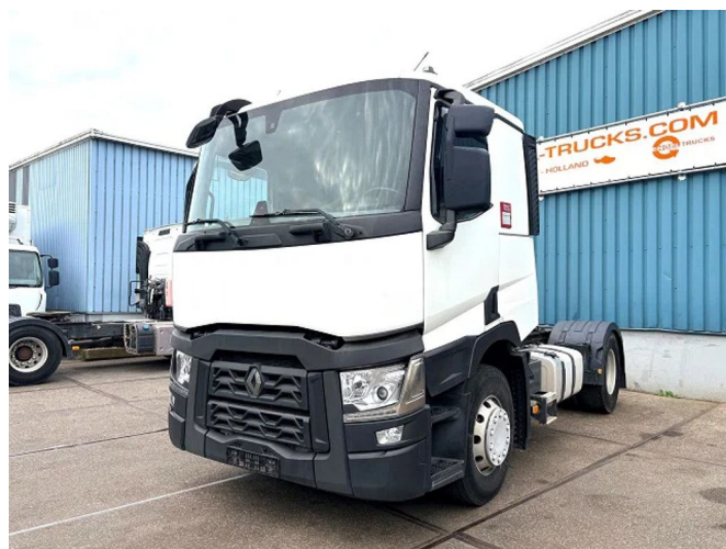
Renault T460 PROTECT SLEEPERCAB (EURO 6 / I-SH... 4x2