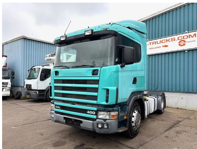
Scania R114-380 LA SLEEPERCAB 4x2 (EURO 2 / MANUAL...