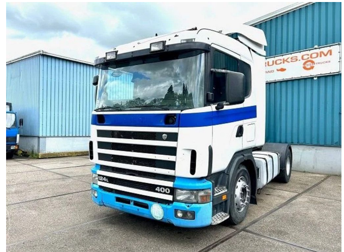
Scania R124-400 L 4x2 SLEEPERCAB ADR/VLG (2 FUEL LI... Referentienummer: SN 55248427