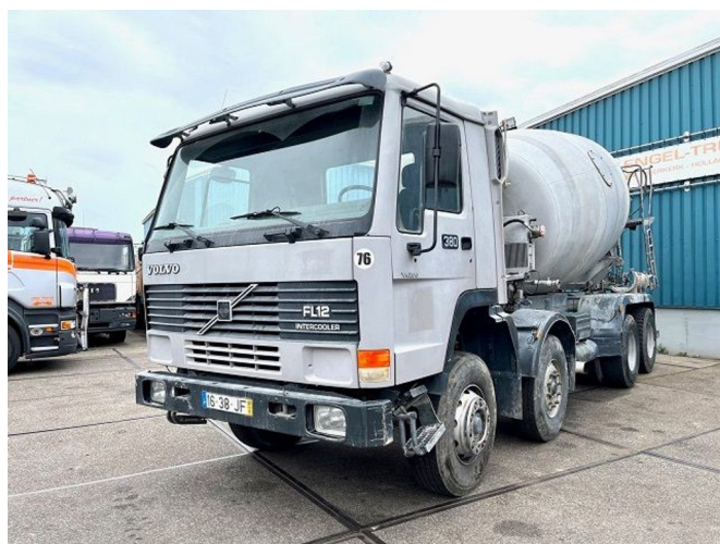
Volvo FL 12 -380 8x4 FULL STEEL CIFA 11M3 CONCRETE M...