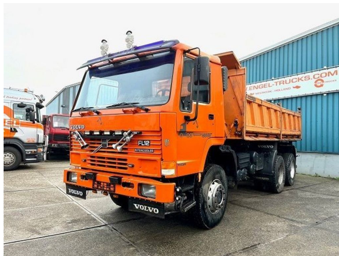
Volvo FL 12.380 6x6 FULL STEEL SUSPENSION MEILLER K... Referentienummer: SN 53819343