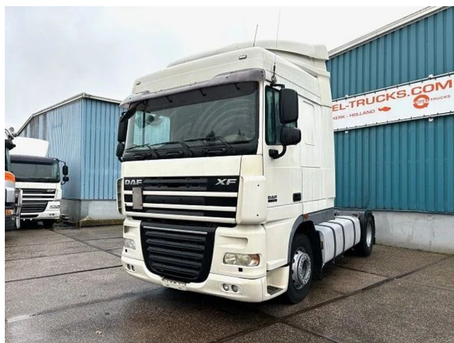
DAF XF 105.410 SPACECAB (ZF16 MANUAL GEARB... 4x2