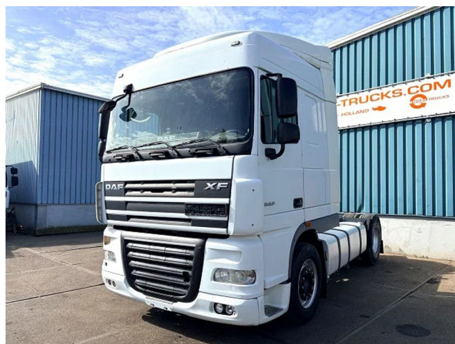
DAF XF 105.460 ATE SPACECAB 4x2 (EURO 5 / AS-TRONIC... Referentienummer: SN 60025857