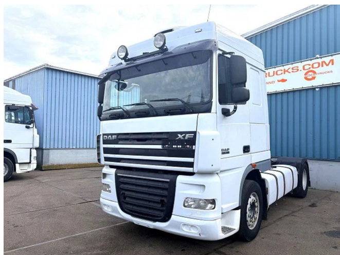
DAF XF 105.460 SPACECAB 4x2 (EURO 5 / AS-TRONIC / ZF...