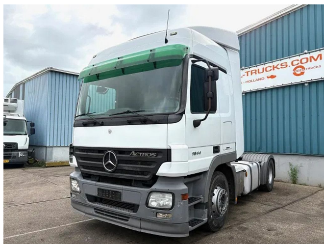
Mercedes-Benz Actros 1844 LS (MP2) (TELLIGENT AU... 4x2