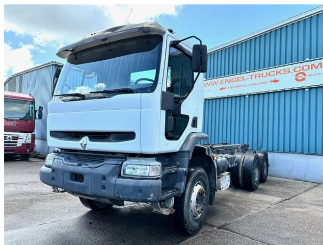
Renault Kerax 320 6x4 FULL STEEL CHASSIS (MANUAL G...