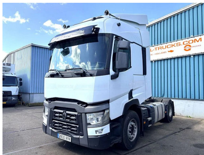
Renault T460 HIGH (EURO 6 / I-SHIFT / RETARDER / ... 4x2 Referentienummer: SN 600122226