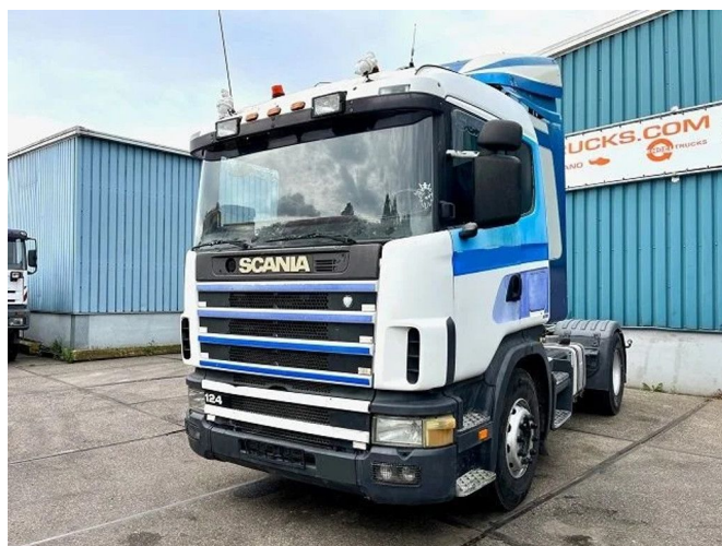
Scania R114-340 LA 4x2 (2 FUEL LINES!!) (EURO 2 / 12 GE... Referentienummer: SN 55071343