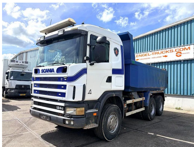
Scania R124-470 C 6x4 FULL STEEL KIPPER (MANUAL G...