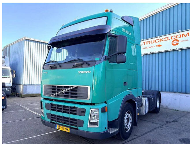
Volvo FH 440 GLOBETROTTER-XL (I-SHIFT / ENGINE... 4x2 Referentienummer: SN 59922077