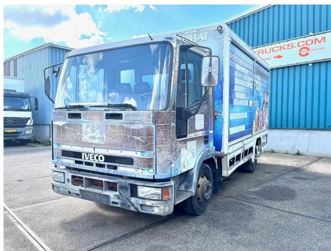
Iveco EuroCargo 75 E12 FULL STEEL CHASSIS WITH ... 4x2