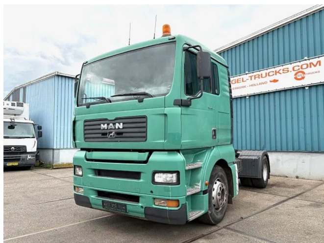
MAN TGA 18.460 FLT XL (6-CILINDER HEADS / ZF16 ... 4x2