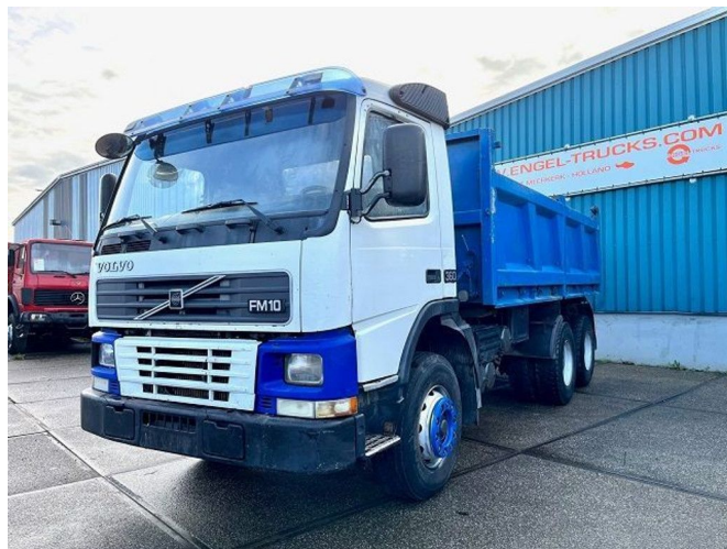
Volvo FM 10.360 6x4 FULL STEEL KIPPER (REDUCTION A...